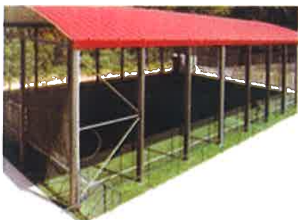
Polidesportivo de Seixezelo