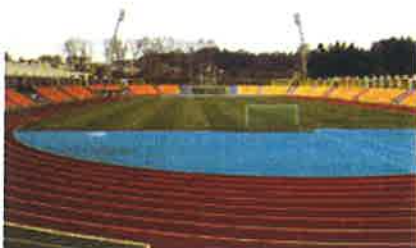
Complexo Desportivo de Pedroso