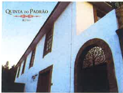
Quinta do Padrão