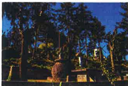
Parque de São Bartolomeu