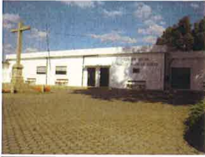
Centro Social Manuel Pinto de Sousa