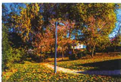
Parque das Corgas